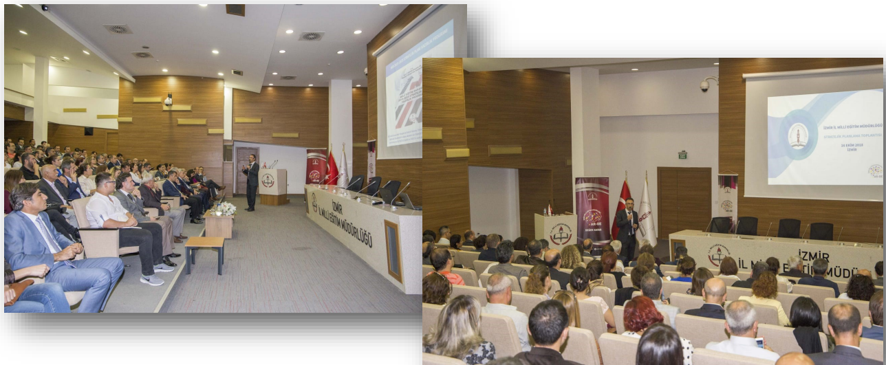
Stratejik Planlama Bilgilendirme Toplantıları